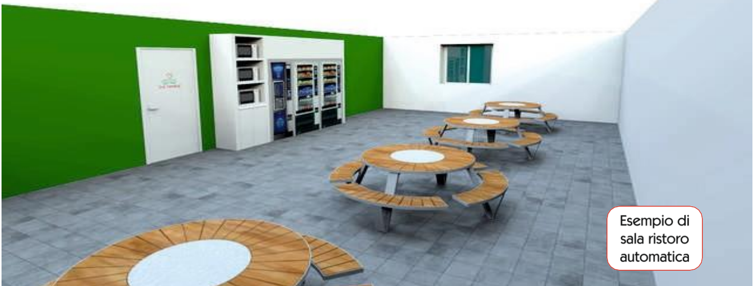
Esempio di sala ristoro automatica

STANDARD CHE VENGONO GARANTITI PRESSO OGNI NOSTRA INSTALLAZIONE.